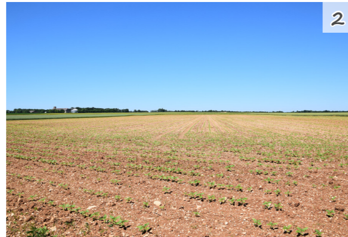
Fig. 14 : Champs cultivés près de Fontaine-Chalendray Fig. 15 : Champs cultivés entre Brettes et Longré