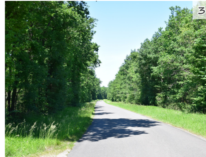
Fig. 16 : Vue limitée au sein d'un bois