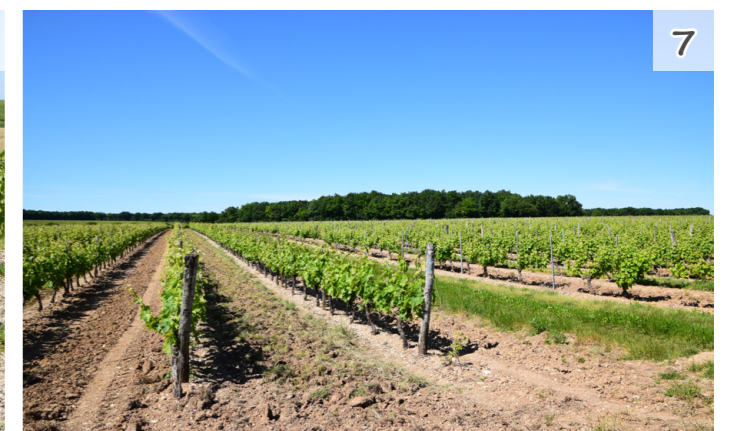
Fig. 20 : Vignes vers Siecq