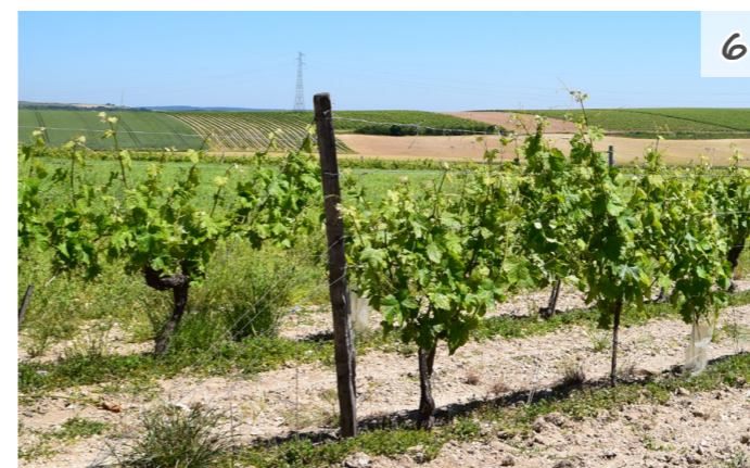
Fig. 19 : Vignes vers Genac

La vigne peut limiter légèrement les vues, le relief dans ces secteurs peut néanmoins créer des vues plongeantes et plus lointaines.