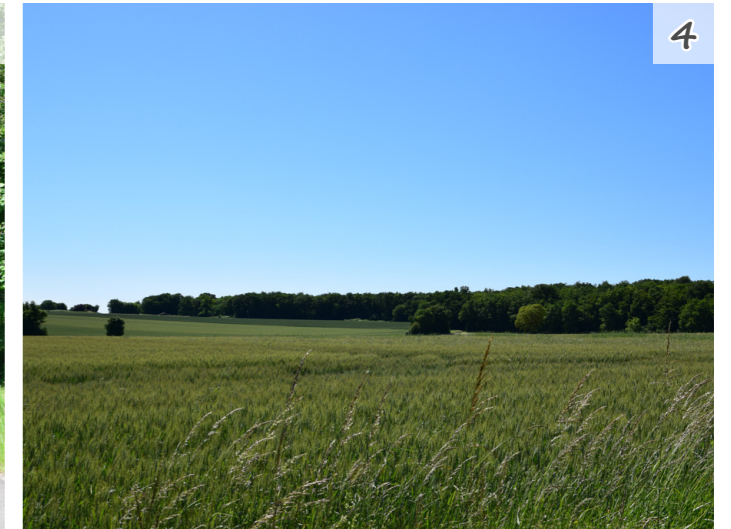
Fig. 17 : Les bois créent des masques vers l'horizon