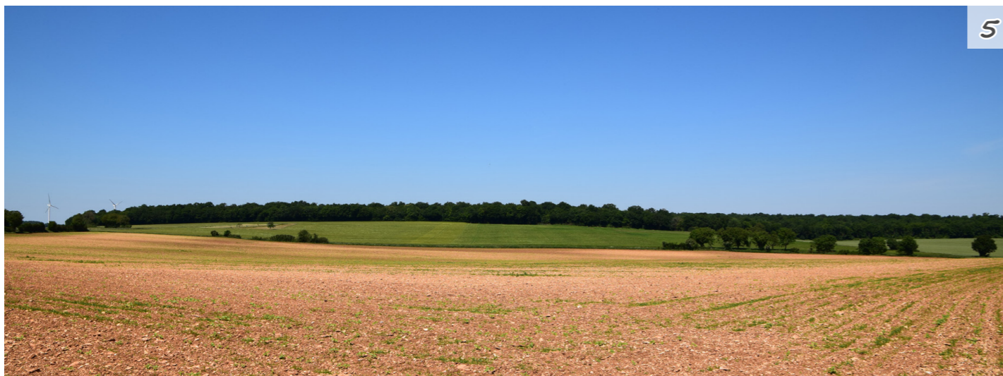
Fig. 18 : Les boisements limitent les vues lointaines

Autour de Ruffec, les petits bois et bosquets sont plus présents. Ils engendrent des vues moins dégagées avec plus de masques. Ces secteurs ont une sensibilité vis-à-vis de la ZIP plus réduite.